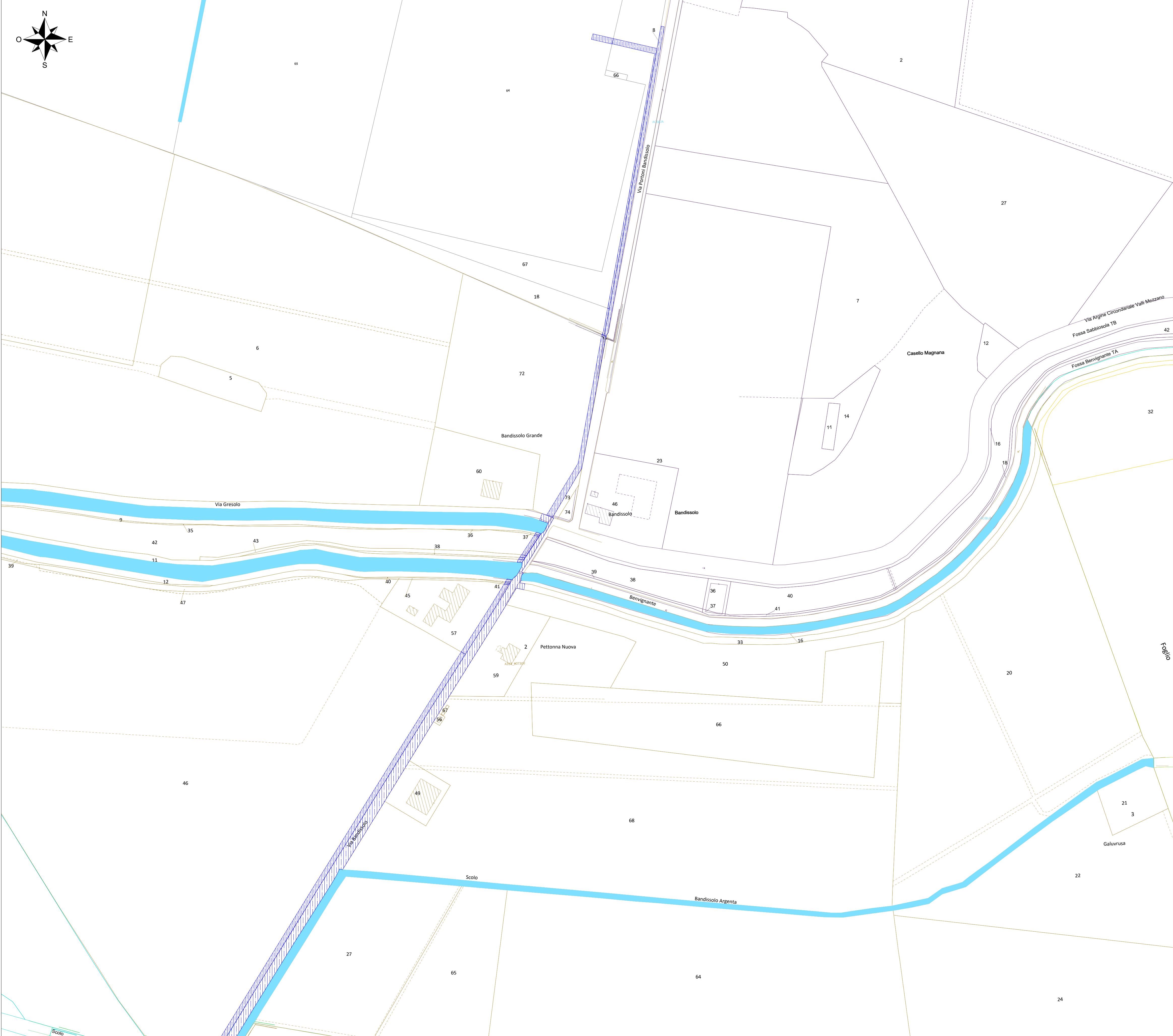
Inquadramento Vista C - Scala 1:2000